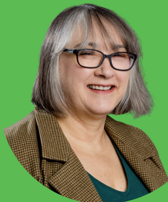
Illustration : Kristina Arakelian